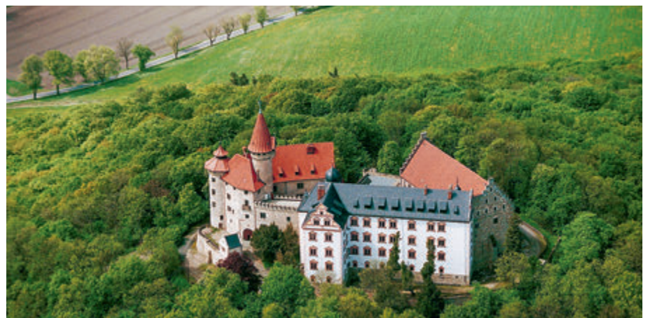
Blick auf die Veste Heldburg.

Tourist Information Thüringen Willy-Brandt-Platz 1, D-99084 Erfurt service@thueringen-entdecken.de barrierefrei.thueringen-entdecken.de bauhaus.thueringen-entdecken.de