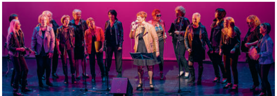
Pop Rock Voices: Für Rock'n Roll ist niemand zu alt. Das bewies der Chor der „School of Rock“.