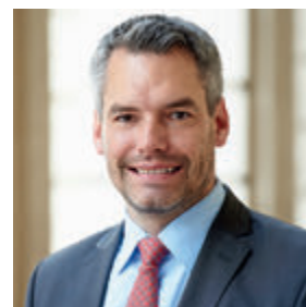
Karl Nehammer Landesobmann

Wir erleben – rund 200 Jahre nach der industriellen – die digitale Revolution. Die industrielle Revolution hat zum Marxismus auf der einen und zur christlichen Arbeiterbewegung und Soziallehre auf der anderen Seite geführt, auf deren Grundsätzen sich der ÖAAB beruft. Es ist unser Anspruch, auch den neuen Herausforderungen auf Basis der Soziallehre zu begegnen. Zahlreiche Funktionärinnen und Funktionäre vertreten die Forderungen des Wiener ÖAAB in der Selbstverwaltung der Sozialversicherungen, in der Wiener Arbeiterkammer, im Landtag und Gemeinderat, im Nationalrat und im Bundesrat, sowie in der Österreichischen Bundesregierung.