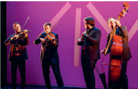
Podokničarji: Ein ganz besonderes Streichquartett mit breitgefächertem Repertoire.