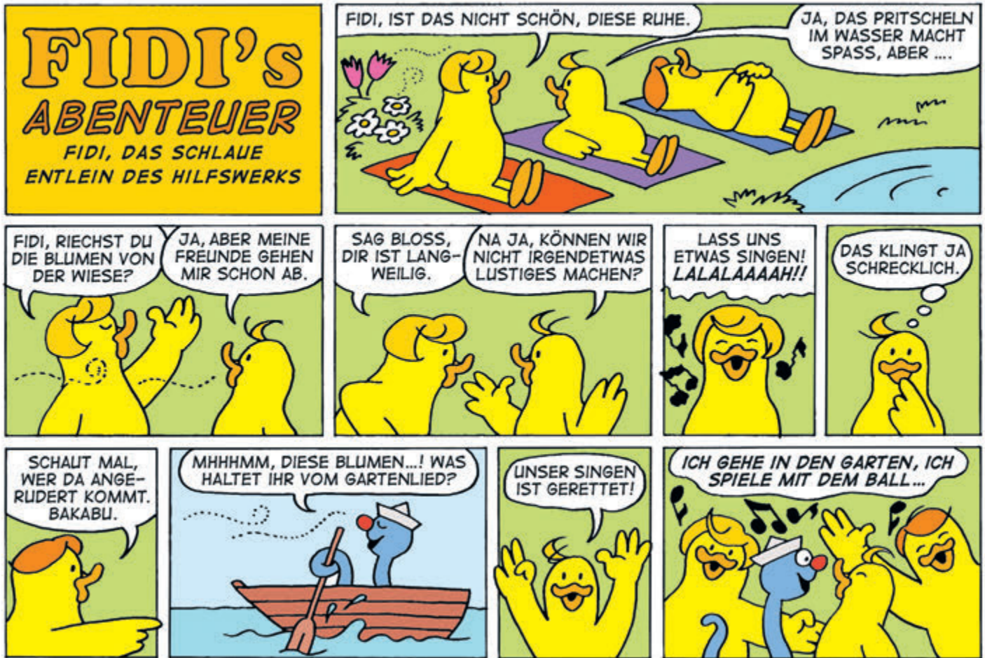
© HILFSWERK ÖSTERREICH / WILLI SCHMID; BAKABU © BY VERMES-VERLAG