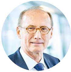
Othmar Karas Präsident Hilfswerk Österreich

„Mobilität bedeutet für ältere Menschen in erster Linie einen Zuwachs an Zufriedenheit und Lebensqualität. Die Förderung der Mobilität muss daher auch in der Pflege höchste Priorität haben. Regelmäßige Bewegung trägt nämlich entscheidend zur physischen und psychischen Gesundheit bei, indem sie Muskelkraft, Balance und Herz-Kreislauf-Funktion verbessert und das Risiko von Stürzen, Herzkrankheiten und sogar Demenz reduziert. Die Pflegekräfte im Hilfswerk passen Bewegungsübungen individuell an und integrieren sie in den Alltag der Kundinnen und Kunden. Gerade bei Bettlägerigkeit sind sanfte Mobilisationsübungen essenziell. Unser Ziel muss es sein, durch gezielte Bewegungsangebote die Beweglichkeit zu fördern, damit ältere Menschen so lange wie möglich selbstständig und unabhängig leben und wohnen können.“