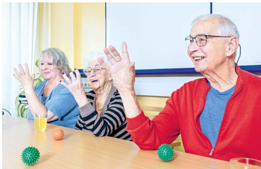
Das Feinmotorik-Training trainiert nicht nur Beweglichkeit und Geschicklichkeit, sondern hält auch das Gehirn in Schwung.