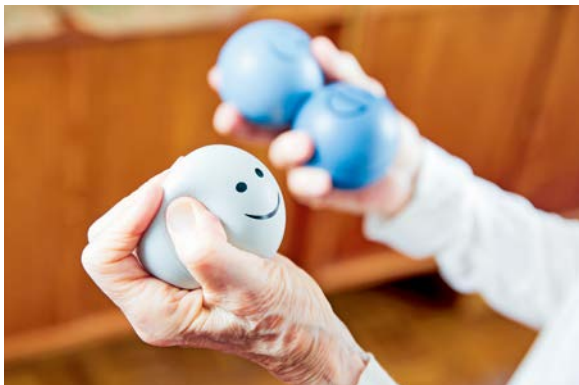
Sanfte Übungen fördern die Mobilität und das Wohlbefinden.

passive Bewegungen können dazu beitragen, dass sich Bettlägerigkeit nicht negativ auf die körperliche Verfassung auswirkt.“ In der Pflege älterer Menschen sollte Bewegung einen zentralen Stellenwert einnehmen. Neben der rein körperlichen Ebene spielt Bewegung auch hier eine wichtige Rolle für das psychische Wohlbefinden. Sie fördert die soziale Teilhabe, stärkt das Selbstbewusstsein und kann das Gefühl von Isolation und Einsamkeit verringern. Pflegekräfte sollten daher darauf achten, Bewegung in den Pflegealltag zu integrieren und individuelle Möglichkeiten zur aktiven Teilnahme am Leben zu schaffen. „Jede Bewegung zählt“ sollte das Motto sein.