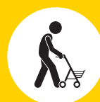
Rollmobil (4-rädriger Rollator)