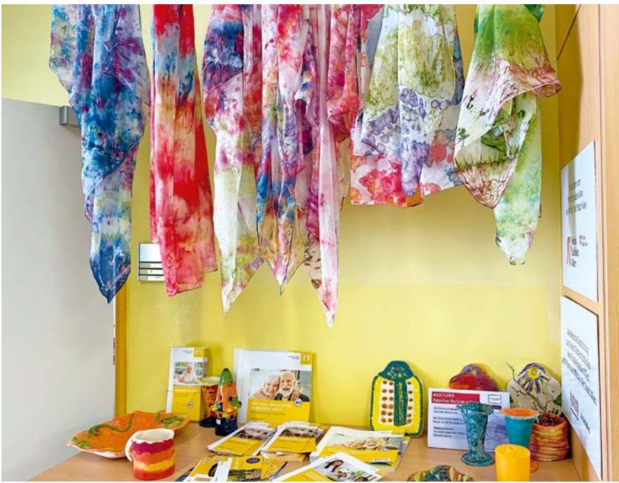
Die bunten Kunstwerke aus der Seidenmalgruppe verschönern den Eingangsbereich.