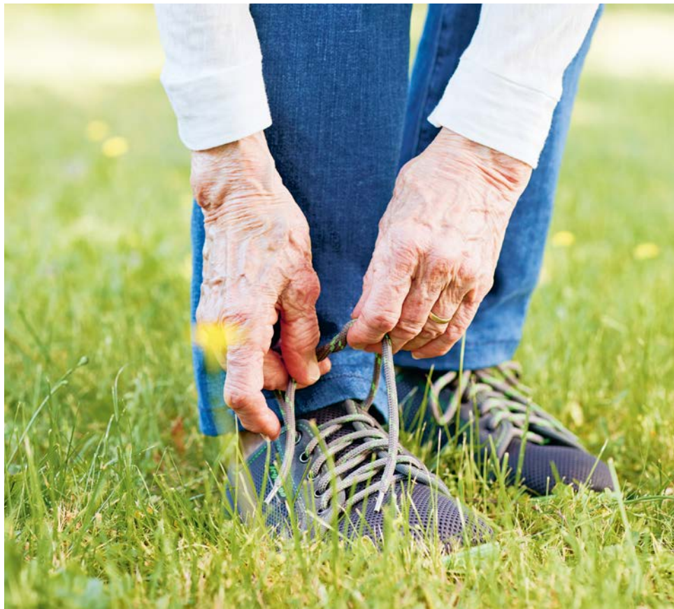
Aktiv bleiben trägt zu einem gesunden und selbstständigen Leben bei.

» BEWEGUNGSVIELFALT FÜR ÄLTERE Bewegung im Alter kann vielfältig sein und muss nicht zwangsläufig das Training im Fitnessstudio bedeuten. Es gibt zahlreiche Möglichkeiten, die auf die individuellen Bedürfnisse und körperlichen Voraussetzungen älterer Menschen zugeschnitten sind. Dazu gehören beispielsweise Spaziergänge im Freien, sanfte Gymnastikübungen, Sessलगymnastik, (Sessel-)Yoga, Wassergymnastik oder auch Tanzen. Wichtig ist dabei vor allem, dass die Bewegung Freude bereitet und keine Überforderung darstellt. Selbst kurze Einhei-