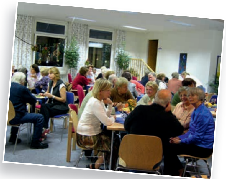
^ Foto von der ersten Weihnachtsfeier im Jahr 2004 im alten Seniorenzentrum beim Airportcenter. Heute steht dort das Designer Outlet