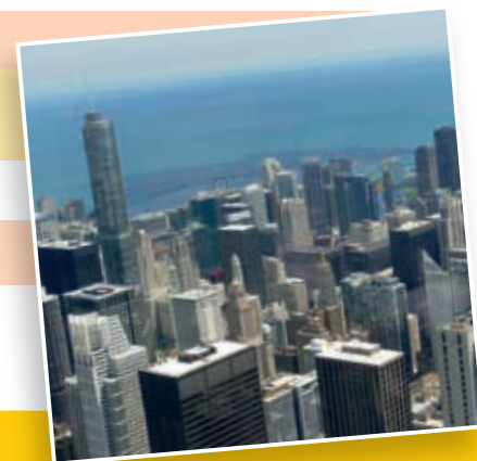
Fotovortrag "Chicago" am 21.05. ^