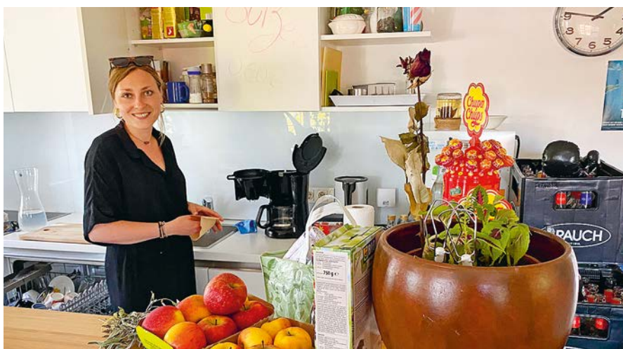
Die besten Partys finden in der Küche statt. Miteinander kochen und essen erfreut sich größter Beliebtheit.

unterstützen, dann bin ich happy. Das ist das Optimum“, so die energiegeladene 28-jährige Pädagogin. Auch Fehler zu machen ist erlaubt, das gehört dazu. „Uns ist es nur extrem wichtig, dass die Jugendlichen in die Selbstverantwortung kommen. Wir ermutigen sie, Struktur in ihrem Alltag zu schaffen und etwas aus ihrem Leben zu machen“, erläutert die Pädagogin.