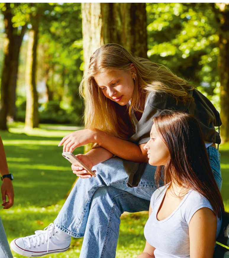
Gemeinsam Zeit mit Gleichaltrigen verbringen stärkt die Jugendlichen.

Moralvorstellungen, über Akzeptanz und Respekt anderen Meinungen und Kulturen gegenüber“, gibt er einen Einblick in seine tägliche Arbeit.