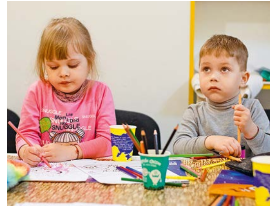
In den Help Points können Kinder den Krieg ausblenden und ganz Kind sein.